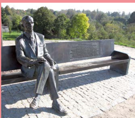
Ławeczka Karaskiego w Łodzi

„Ci, którzy znali Jana Karaskiego, nigdy go nie zapomną. Jego przesłanie będzie rozświetlać ścieżkę kochających wolność przez lata, które nadejdą. Nie można sobie wyobrazić lepszego dziedzictwa” – Bill Clinton