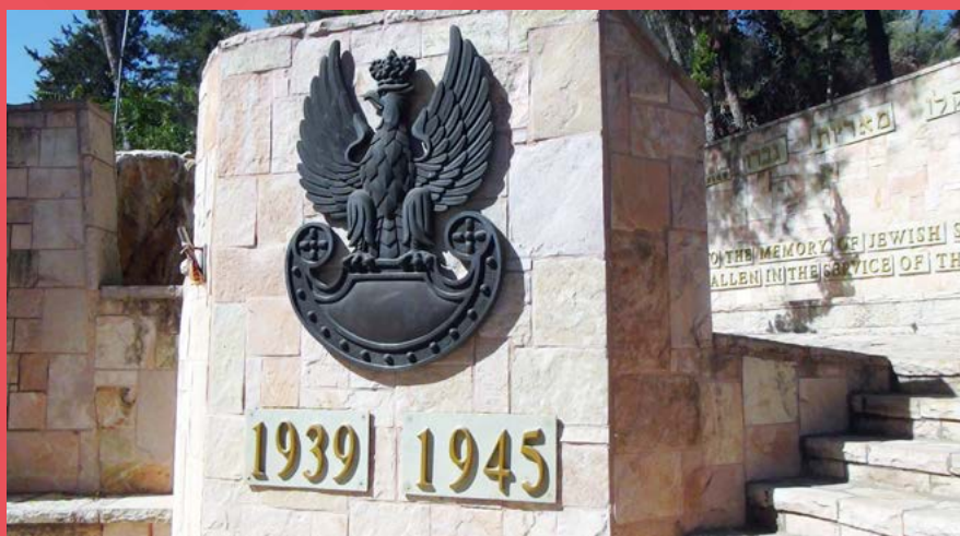
Upamiętnienie polskich żołnierzy II wojny światowej na Górze Herzla w Jerozolimie

„(...) Kompleksowe podejście do tematu Zagłady to następny pozytywny aspekt seminarium. Kluczową rolę odegrały zasoby Instytutu Yad Vashem, które dotyczą zagadnienia, wykorzy-