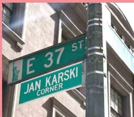
Ulica Karaskiego na Manhattanie

Zapraszamy Państwa do odwiedzenia zakładki na stronie ORE i zapoznania się z sylwetką i historią tej niezwykłej postaci. Udostępniliśmy także dla Państwa kalendarz wydarzeń, które uświetnią obchody Roku Jana Karaskiego, w tym informacje o działaniach edukacyjnych programu Jan Karaski. Niedokończona misja .