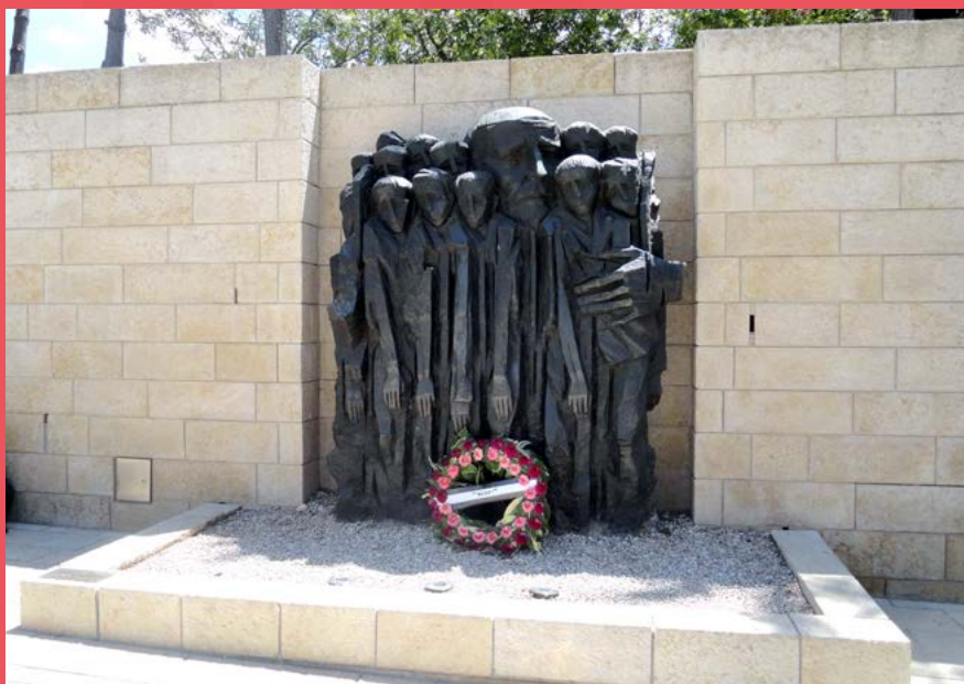
Pomnik Korczaka i Dzieci Getta

Uczenie się o Holokauście jako o doświadczeniu ludzkim wykracza poza granice dyscypliny historycznej. Dla-